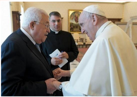
دیدار محمود عباس با پاپ