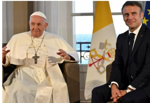
دیدار رئیس جمهور فرانسه با پاپ