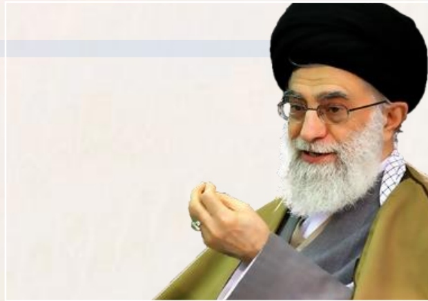
بیانات مقام معظم رهبری به مناسبت میلاد حضرت مسیح(ع)

اگر امروز مسیح بود اگر حضرت عیسی مسیح (علیه السلام) امروز در میان ما می بود، لحظه‌ای را برای مبارزه با سردمداران ظلم و استکبار جهانی از دست نمی داد و گرسنگی و سرگردانی میلیاردها انسانی را که به وسیله قدرت‌های بزرگ، استثمار و به جنگ و فساد و ستیزه خویی سوق داده می شوند، تحمل نمی کرد.