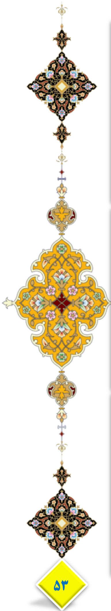
هفته نامه سفارت جمهوری اسلامی ایران در واتیکان